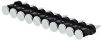
C6 Standardnägel für Beton (weich) und Stein